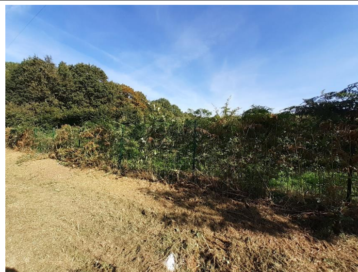
Photo 24 : Vue vers le site depuis l'Allée de la Forêt (partie Nord)