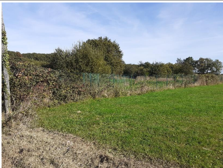
Photo 27 : Vue vers le site depuis la zone d'habitation au Sud-Ouest