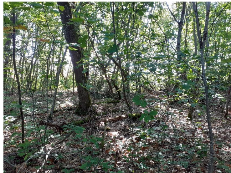
Photo 22 : Vue vers le site depuis le sentier au Nord (site non visible)