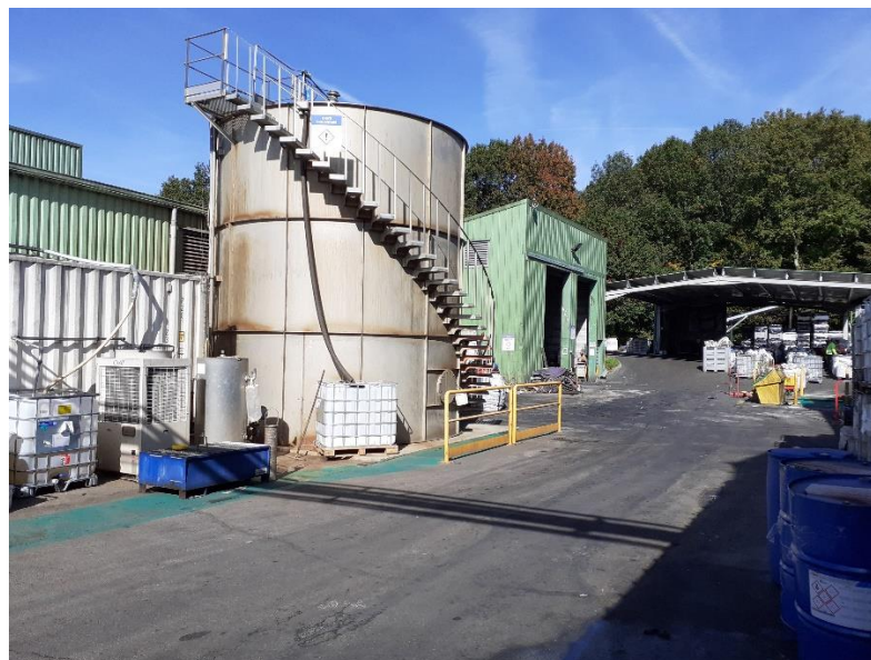
Photo 6 : Container unité d'ultrafiltration et cuve réacteur biologique