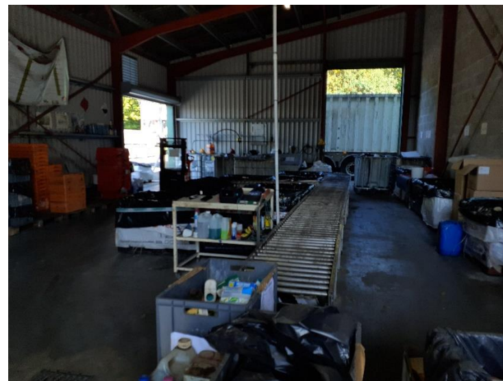
Photo 4 : Bâtiment D2 – Tri des déchets en petits conditionnements