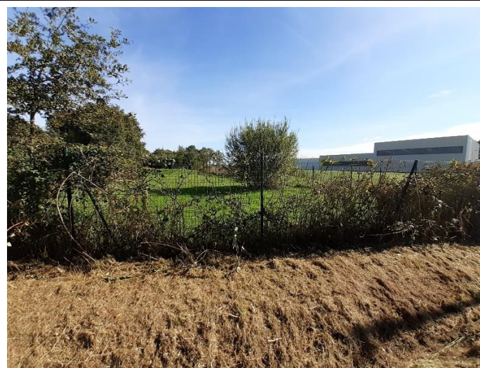
Photo 26 : Vue vers le Sud du site depuis l'intersection de l'allée de la forêt et l'allée de l'orée du bois