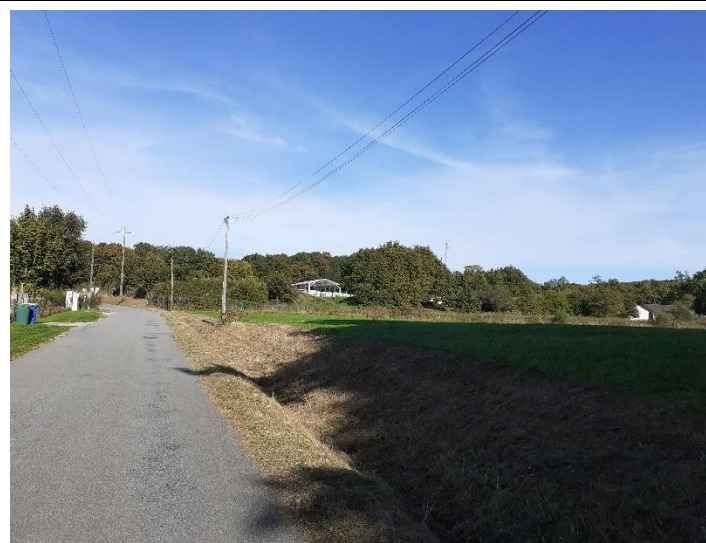
Photo 28 : Vue vers le site depuis la zone d'habitation au Sud-Ouest