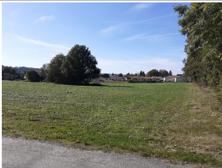
Photo 23 : Vue vers la friche et la zone d'habitations à l'Ouest du site